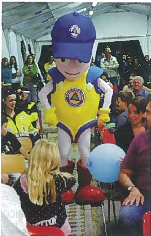
Civilino incontra i suoi fans