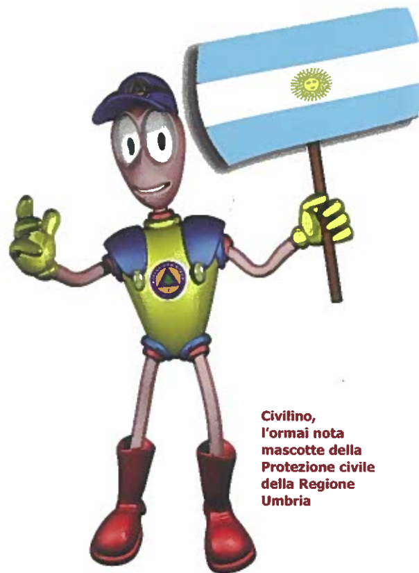
Civilino, l'ormai nota mascotte della Protezione civile della Regione Umbria