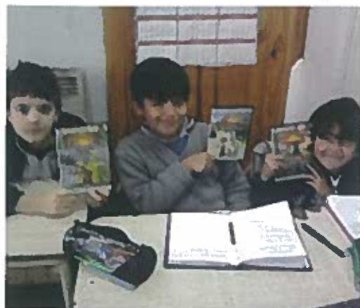
Civilino supera le frontiere nazionali e diventa idolo dei bambini della scuola 'Manuel Lainez - n. 62' di Buenos Aires