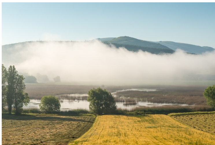
Giornata nebbiosa a Colfiorito

Il Parco di Colfiorito, la più piccola tra le aree protette presenti in Umbria, è caratterizzato dalla omonima palude, compresa tra le zone umide di im-