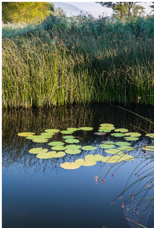
Ninfee a Colfiorito

Per quanto riguarda gli scarichi di origine civile: l'abitato di Colfiorito, previa depurazione, scarica al di fuori del bacino insistente sulla palude. Gli scarichi delle frazioni di Forcatura e Casette di Cupigliolo non sembrano incidere sulla qualità delle acque della palude, poiché vengono "assorbiti" dal sottosuolo carsico; tuttavia è da segnalare l'attuale stato di disattivazione del depuratore di Casette.