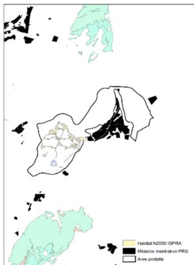
Figura 1: Relazioni tra mosaicatura del Piano ed estensione degli habitat

Il Parco ha una posizione baricentrica rispetto ad un sistema piuttosto esteso di siti natura 2000 umbri: nel raggio di 2 km se ne trovano ben 5 (Col Falcone, Piani di Annifo-Arvello, Palude di Colfiorito, Piano di Ricciano e Selva di Cupigliolo) la cui superficie totale di 1150 ha è quasi 3,5 volte superiore a quella del Parco.