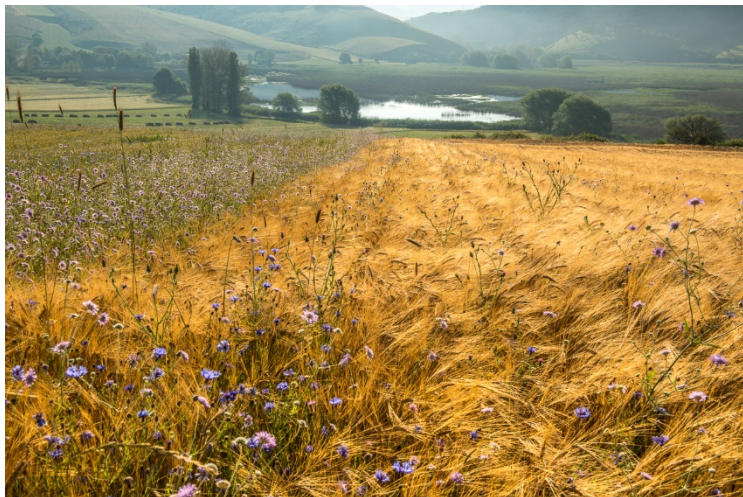
La palude di Colfiorito vista dai coltivi

Il Parco, situato nell'Appennino centro-occidentale, presenta al suo interno un complesso pianeggiante di conche di origine tettonico-carsica di grande estensione. L'altipiano è composto da sette conche, che si sviluppano fra i 750 e gli 800 m di quota, in gran parte costituite dai resti di antichi laghi prosciugatisi naturalmente o bonificati dall'uomo; i Piani di Colfiorito, Cesi e Popola, Ricciano, Arvello, Annifo, Colle Croce e la Palude di Colfiorito.