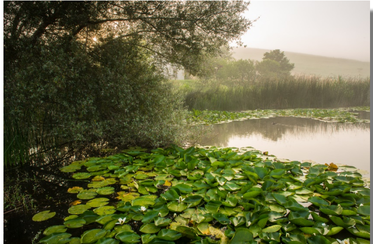
Ninfee a Colfiorito

Gli Altipiani di Colfiorito sono un sistema di sette depressioni tettoniche con fenomeni carsici, che si trova nella dorsale appenninica umbro-marchigiana (Italia). Questa zona è caratterizzata dalla presenza di zone umide molto importanti dal punto di vista floristico, in quanto al loro interno si registra la presenza di specie importanti a livello regionale e dell'Italia centrale. Recenti studi hanno segnalato in questi territori la presenza di 11 nuove specie non segnalate in precedenza, per la flora dell'Umbria: Avena sativa subsp. macrantha , A. sterilis subsp. ludoviciana , Chenopodium hybridum , Cuscuta campestris , Mentha arvensis , Rosa andegavensis , R. dumalis , Schedonorus uechtritzius , Scrophularia umbrosa , Trifolium alexandrinum e Veronica Catena (Ballelli et al., 2010). Numerose sono le specie rare e minacciate come ad es. Alopecurus bulbosus , Carex tomentosa , Equiseto fluviatile , Juncus hybridus , Nymphaea alba , Ophioglossum vulgatum , Ranunculus flammula , R. ophioglossifolius , Trifolium patense e Utricularia australis . Tuttavia alcune specie, precedentemente segnalate per la Palude di Colfiorito, come Eriophorum latifolium , Hippuris vulgaris , Hydrocotyle vulgaris , Menyanthes trifoliata , Potamogeton Lucens , P. trichoides , Ranunculus lingua e Triglochin palustre , non sono stati ritrovate e considerate localmente estinte (Ballelli et al., 2010).