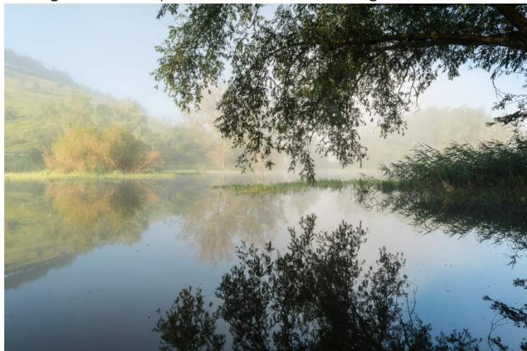
Vegetazione ripariale a Colfiorito

In conseguenza della pressione che le attività agricole esercitano su queste aree, spesso situate in contatto con