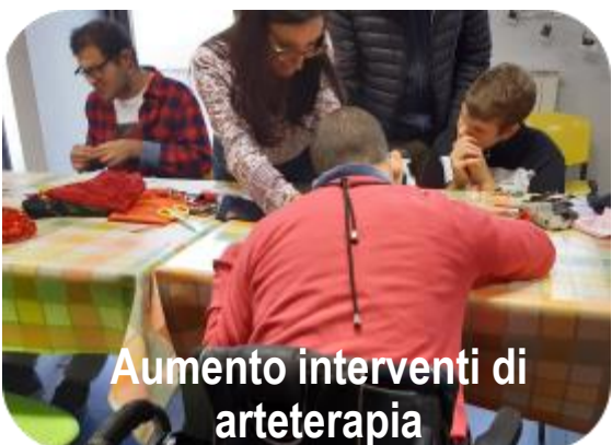
Aumento interventi di arteterapia