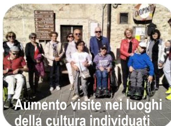
Aumento visite nei luoghi della cultura individuati