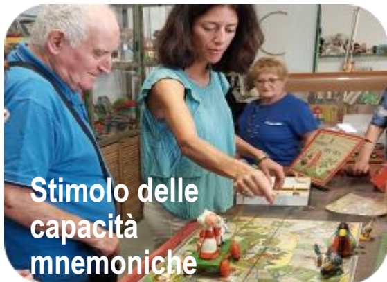
Stimolo delle capacità mnemoniche