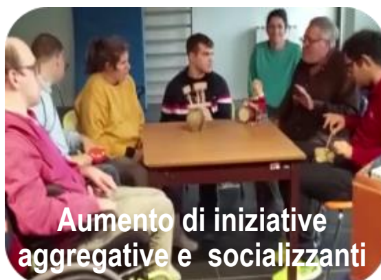
Aumento di iniziative aggregative e socializzanti