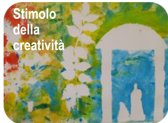
Stimolo della creatività