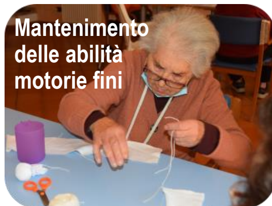
Mantenimento delle abilità motorie fini