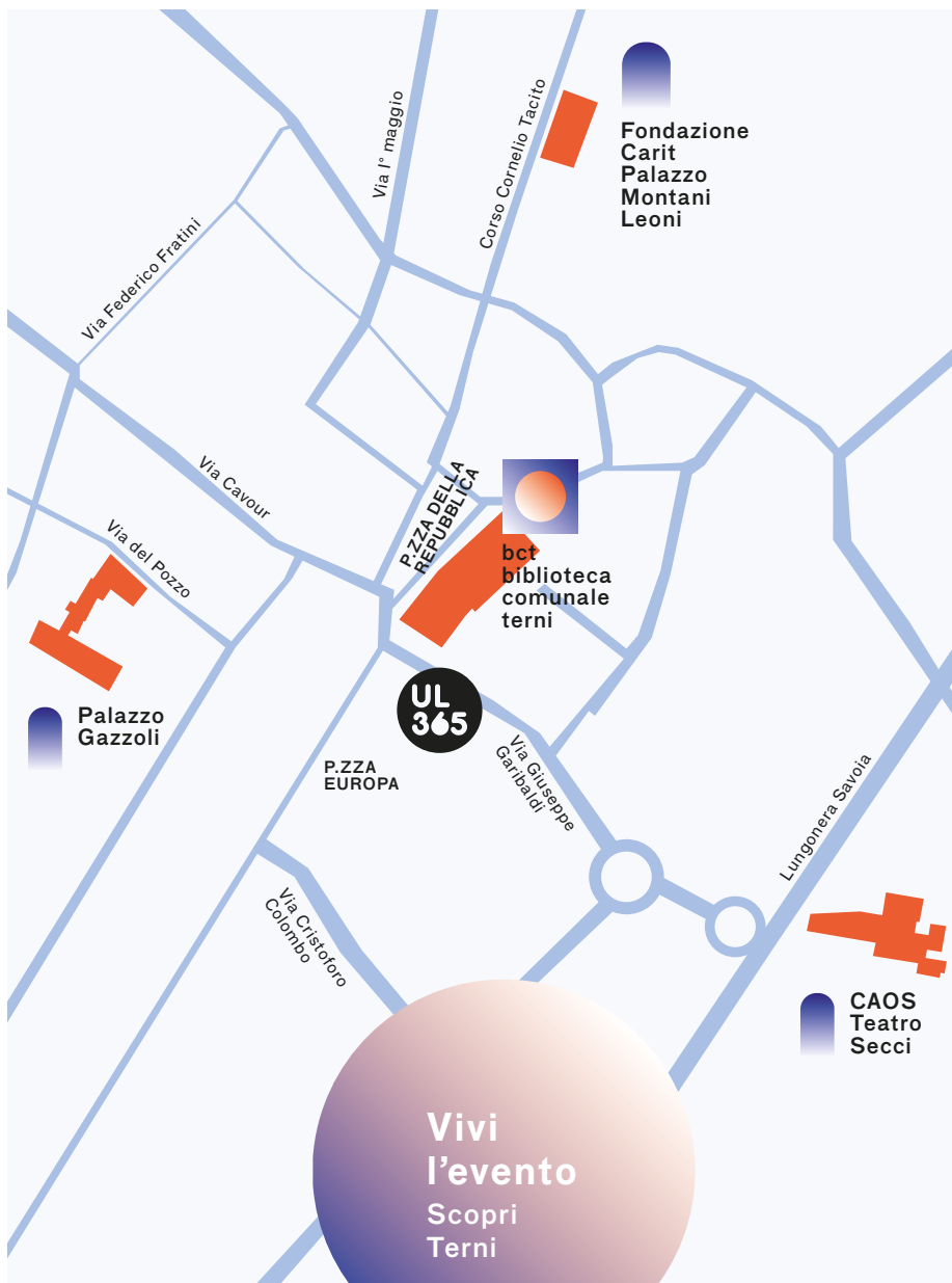
MAPPA EVENTI TERNI