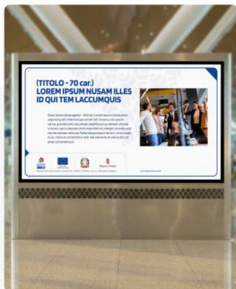
Display con immagine 16:9