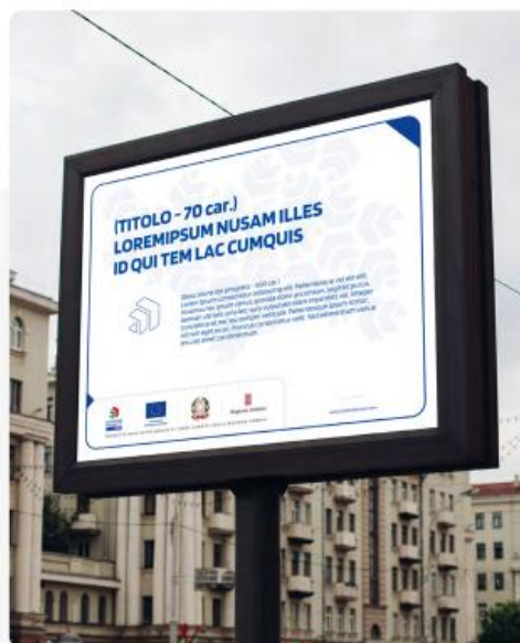
Display senza immagine 4:3