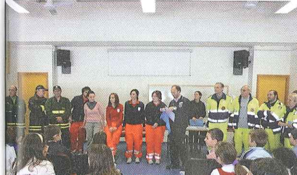
A lezione di Protezione civile

E' dal 2008 che l'ANCI Umbria, in sinergia con la Regione, ha attivato una intensa attività di realizzazione e gestione di progetti e iniziative finalizzate a sostenere politiche e servizi per la Protezione civile partendo dal riconoscimento del ruolo centrale del Comune nel complesso sistema della Protezione civile e della conseguente necessità di supportare processi di crescita dal basso fondati sul principio di sussidiarietà orizzontale. Una pianificazione locale efficace diventa la base per quella che sarà una pianificazione sovraordinata sia a livello intercomunale sia a livello provinciale, secondo un percorso dinamico che vede modelli e mezzi soggetti a verifica e aggiornamento costante. A seguito del protocollo d'intesa tra il Dipartimento della Protezione civile del Consiglio dei Ministri e l'ANCI siglato nel gennaio 2008, che vede tra i punti sostanziali il ruolo fondamentale dei Comuni nel sistema della Protezione civile e la necessità di sviluppare azioni a supporto delle attività di previsione e prevenzione, ANCI Umbria diventa promotrice di importanti progetti di carattere territoriale, nazionale ed europeo. A rinnovare l'important