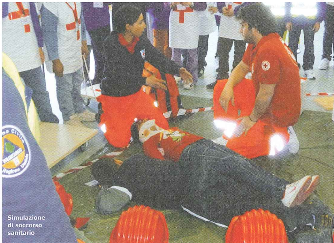
Simulazione di soccorso sanitario

za del ruolo dell'ANCI in merito alle attività di Protezione civile è stato siglato lo scorso maggio 2013 tra il Dipartimento della Protezione civile del Consiglio dei Ministri e l'ANCI un nuovo protocollo con lo scopo di sviluppare un