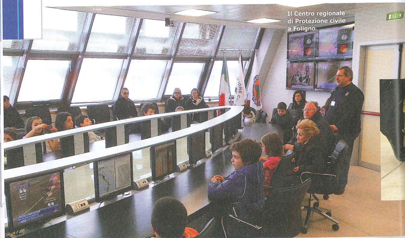
Il Centro regionale di Protezione civile a Foligno.