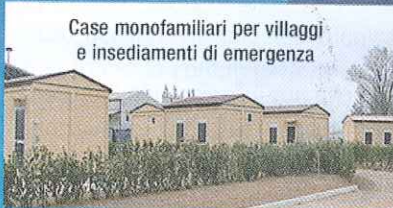
Case monofamiliari per villaggi e insediamenti di emergenza

New House Spa è società fornitrice della Protezione Civile Italiana. Ha fornito complessivamente circa 150.000 mq. di prefabbricati per uso abitativo, scuole, centri sociali e direzionali, intervenendo sul territorio con le prime costruzioni appena 10 giorni dopo gli eventi.