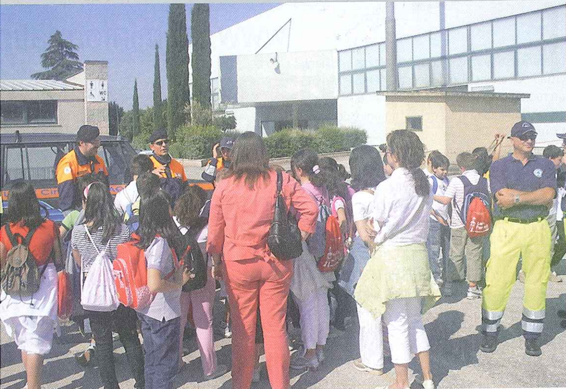
Esercitazioni con i più piccoli